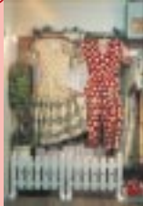
とってもかわいい店内

- すこい品揃えですね。どんな方から? 全国のファンの方、提携しているショップ やマヌカンさん、それと、タレントさんの 衣装コーディネートに頼まれたりする関係 で、芸能関係の方等、リピーターの方が 多く、本当にありがたいですね。