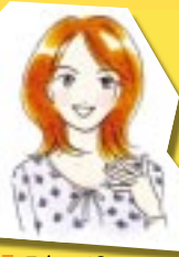
スタッフC (アドバイザー歴6年)

また、売りたい方は前もってお電話いただければ宅急便もご利用いただけます。 本店(鶴橋)のみ