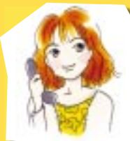
スタッフD (アドバイザー歴3年)

アゲインではヤングからアダルトまでのレディース&メンズのファッションに関する物すべてを取り扱っています。インポートの高額品に限らず、国内のDCブランドやアパレルメーカー人気ブランド、セレクトショップからインディーズ系まで幅広く取り扱っています。