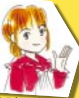
スタッフA (アドバイザー歴9年)

スタッフ全員が全ての商品にいつでも同じ金額を出せないと、お客様にご迷惑をかけるアゲインではどの商品が「いくらで売れたか」を見ていただくことが重要だと考えているので、最初は高めの販売価格からスタートして、売れなければ少しずつ値段を下げていくと、結果的によりたくさんのお金をお客様にお返しできる場合が多かったので、また、アゲインでは通常35%の手数料をいただいておりますが、高額商品については特別な低手数料システム(右ページ参照)もありますので、ご相談下さい。